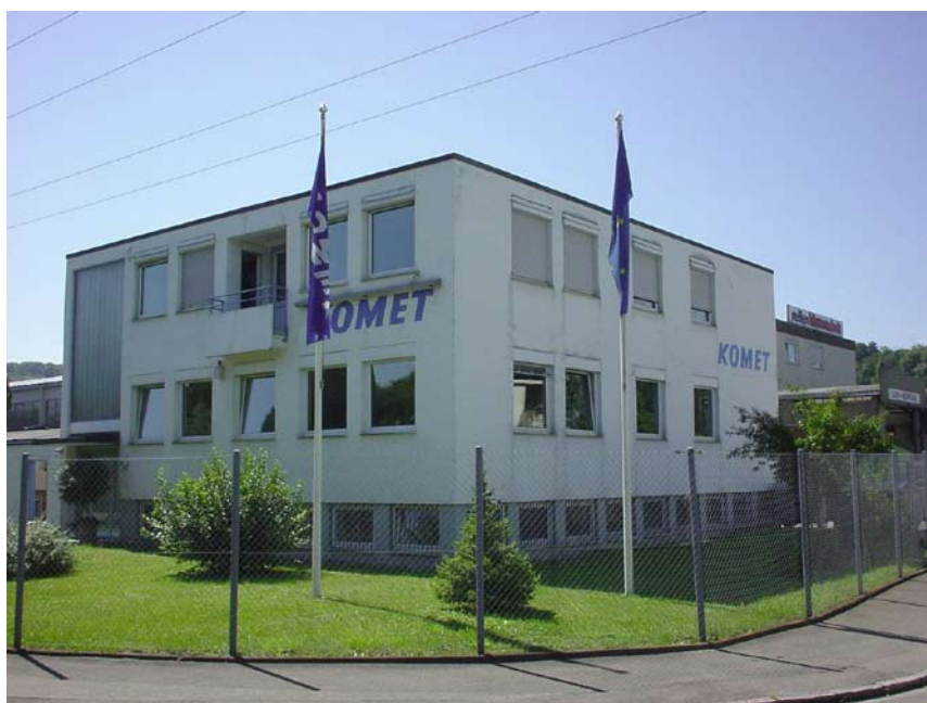
Kometfabriken i Plochingen (sydtyskland)